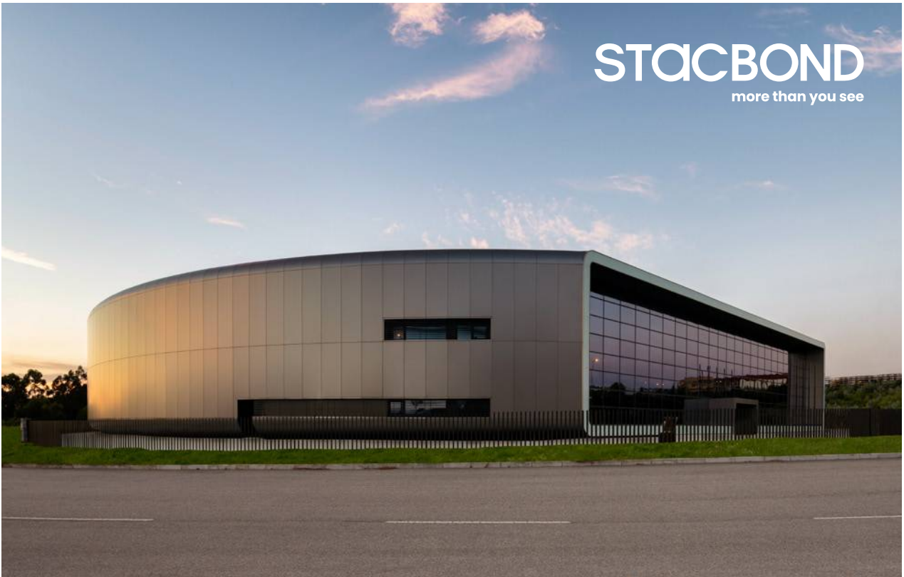
Tromilux | Headquarters | Vila Nova de Gaia, Portugal | STB - 402