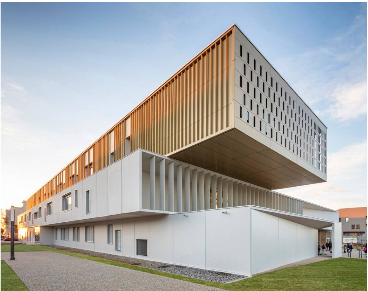
Germaine Richier School | Montpellier, France | STB - 454